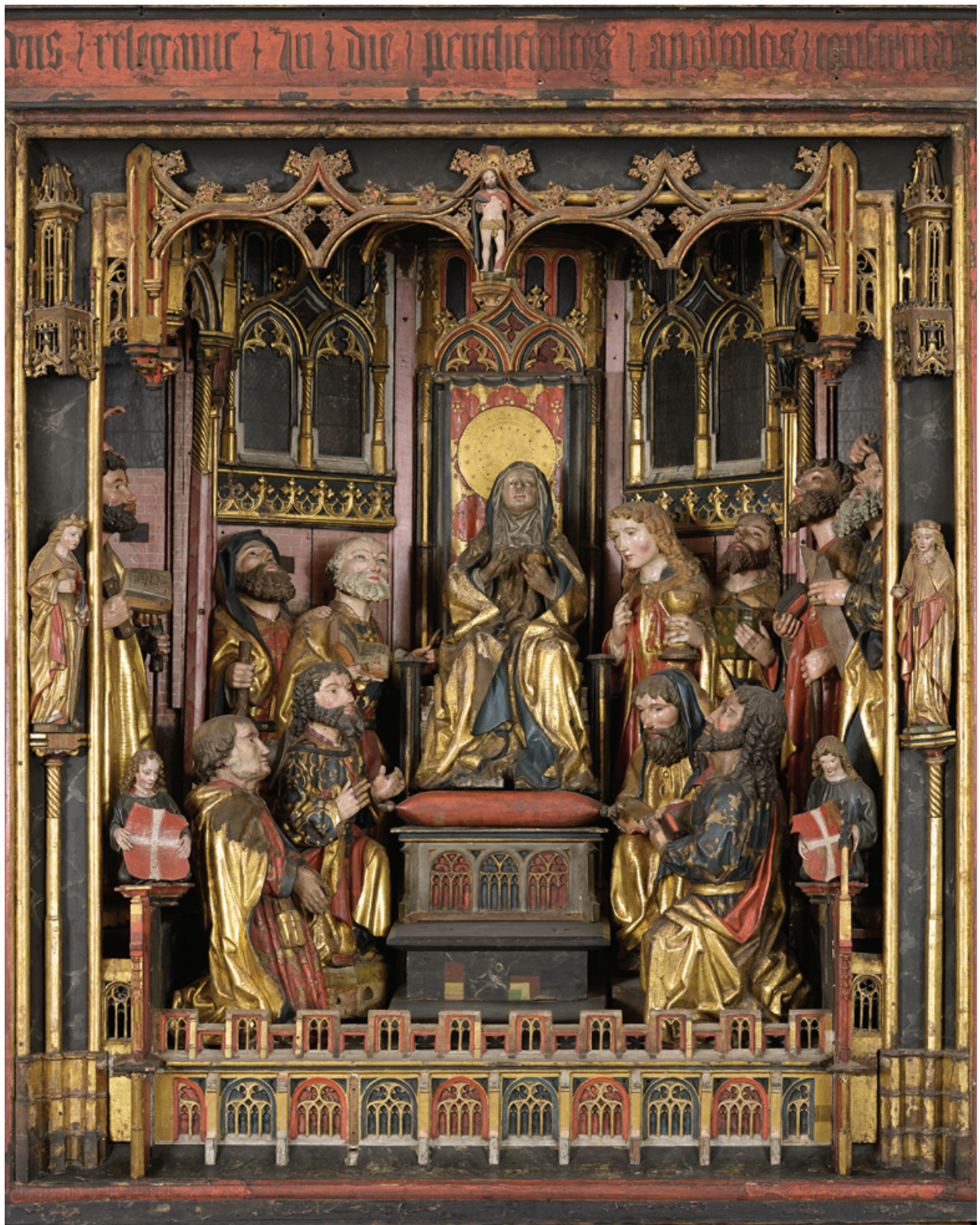
Neitsi Maarja ja apostlid retaabli korpuses