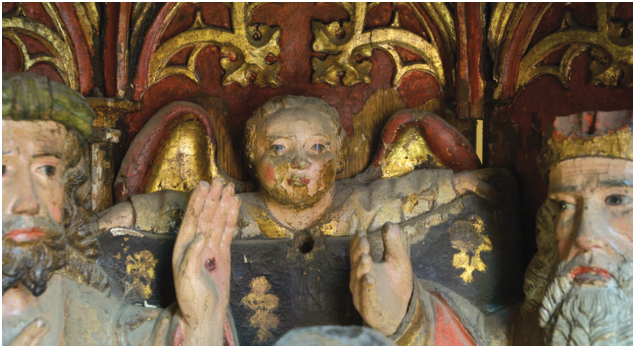
Maarja krooni taha jääv ingel draperiiga