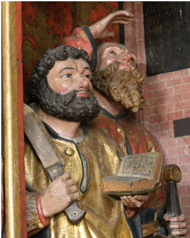
Bartolomeus ja Paulus