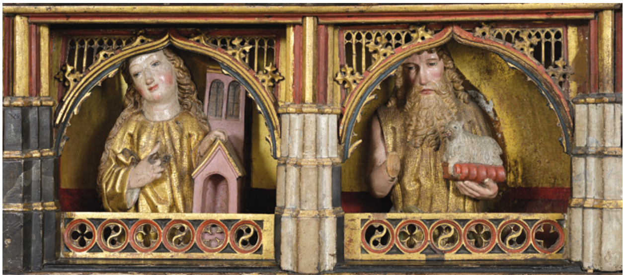
Barbara ja Ristija Johannes