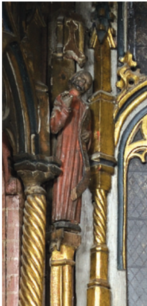
Prohvetid Tobias ja Hiib