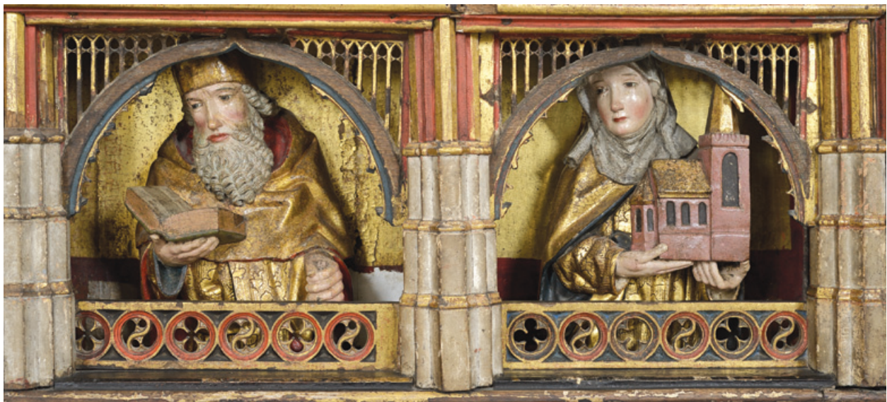
Antonius Suur ja Gertrud

Suurte figuuride alla jäävas soklis ehk n-ö pseudopredellas võib näha nelja pühaku poolfiguuri: Barbara, Ristija Johannes, Antonius Suur ja Gertrud.