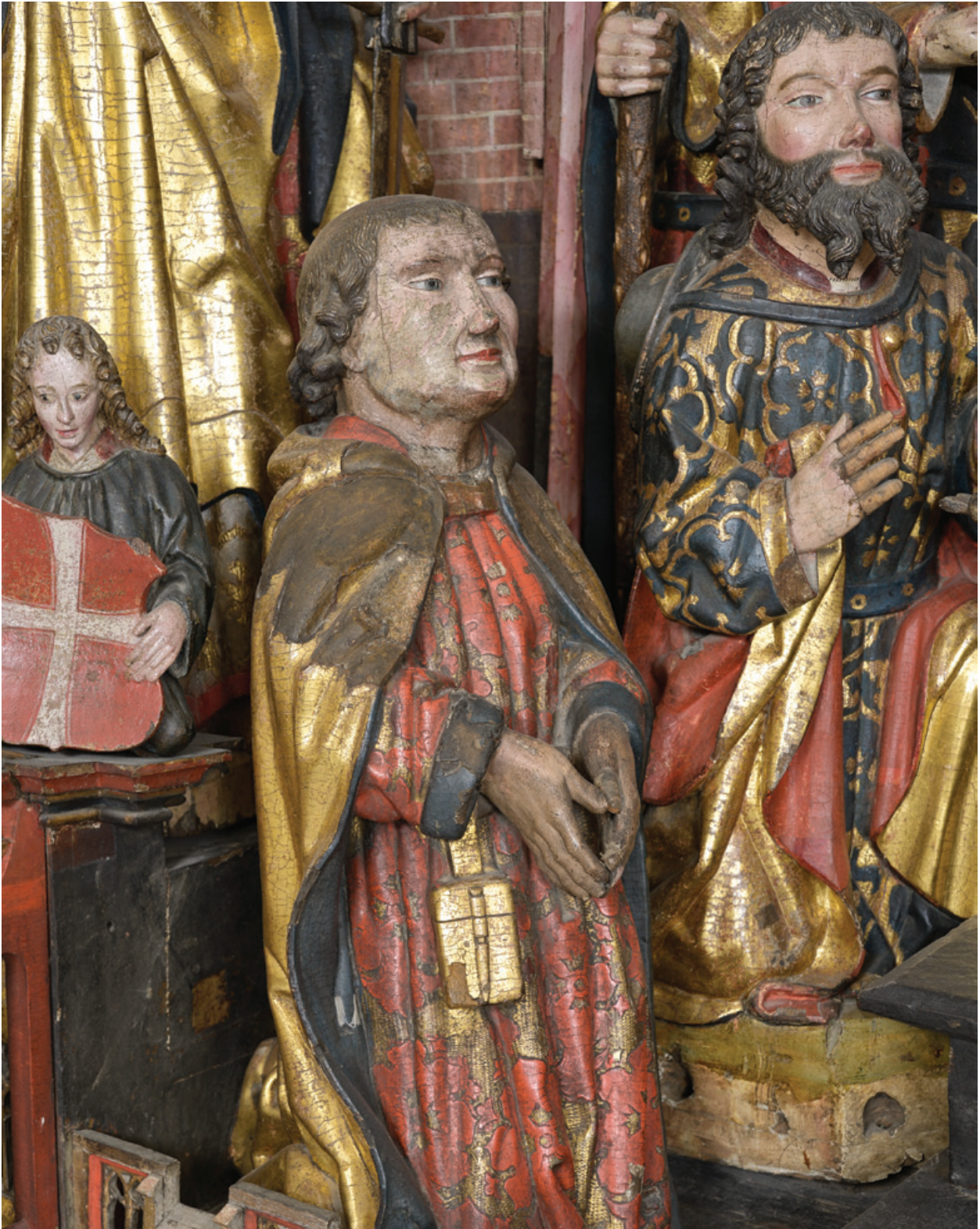
Palveasendis donaator, kes on ühtlasi üks apostlitest. Tema kõrval Jaakobus Vanem