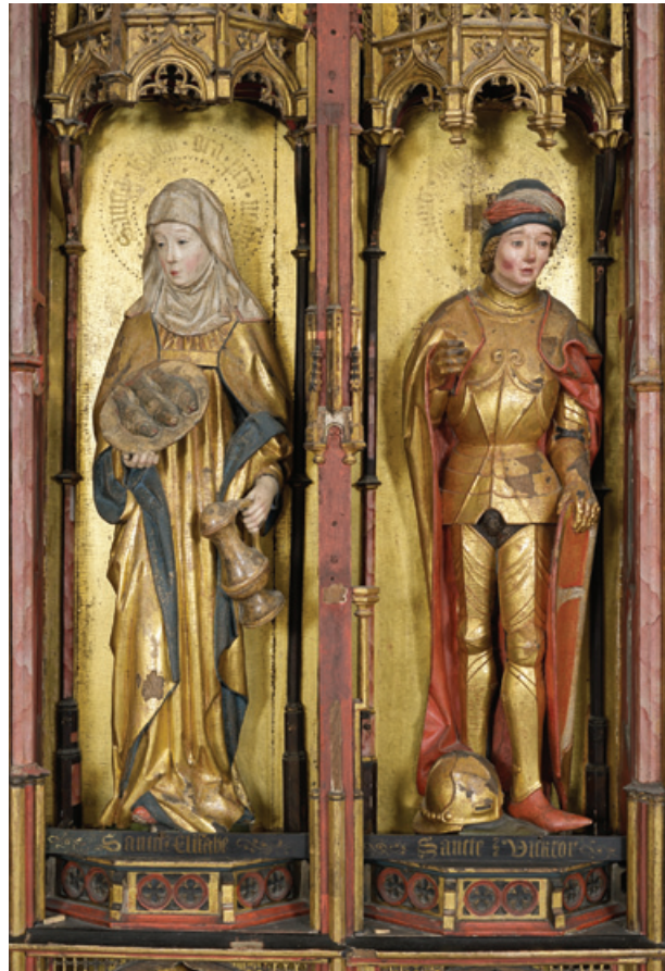
Vasakul Elisabeth, paremal Viktor

Retaabli tiibadel seisavad uhkete nikerdbaldahhiinide all suured pühakufiguurid, vasakul Olav ja Anna koos Neitsi Maarja ja Jeesuslapsesega, paremal Elisabeth ja Viktor – Tallinna kaitsepühak. Pühakud on äratuntavad nii oma atribuutide kui ka nende all olevate nimetahvlite järgi: Sancte Olawus , Sancta Anna , Sancta Elisabe , Sancte Viktor . Pühakute nimed koos traditsioonilise palvega ora pro nobis (palveta meie eest) on lisatud ka nende aupaiestele: Sancte Olawus ora pro nobis , Sancta Anna ora pro nobis , Sancta Elisabe ora pro nobis , Sancte Viktor ora pro nobis .