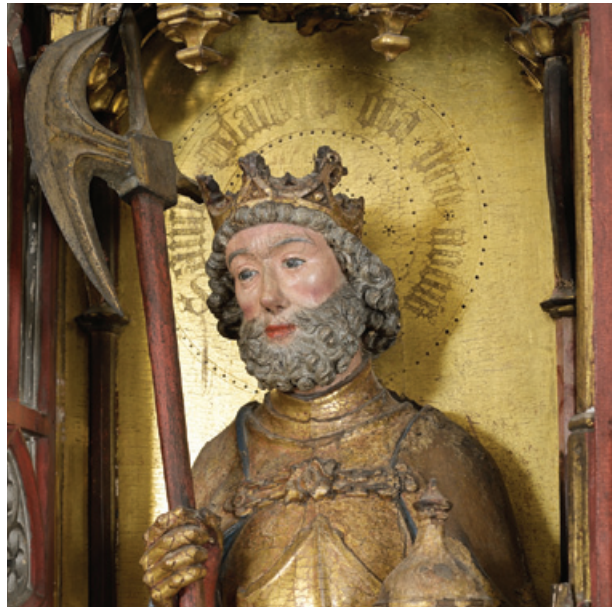
Olavi aupaiestes pea

Retaabli tiibadel seisavad uhkete nikerdbaldahhiinide all suured pühakufiguurid, vasakul Olav ja Anna koos Neitsi Maarja ja Jeesuslapsesega, paremal Elisabeth ja Viktor – Tallinna kaitsepühak. Pühakud on äratuntavad nii oma atribuutide kui ka nende all olevate nimetahvlite järgi: Sancte Olawus , Sancta Anna , Sancta Elisabe , Sancte Viktor . Pühakute nimed koos traditsioonilise palvega ora pro nobis (palveta meie eest) on lisatud ka nende aupaiestele: Sancte Olawus ora pro nobis , Sancta Anna ora pro nobis , Sancta Elisabe ora pro nobis , Sancte Viktor ora pro nobis .