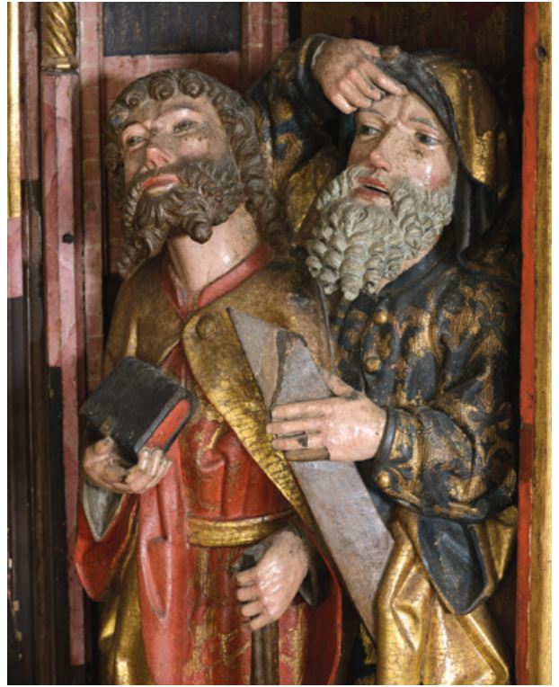
Apostel nuiaga ja Andreas