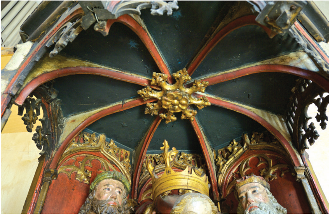
Tabernaakli lagi roosiga