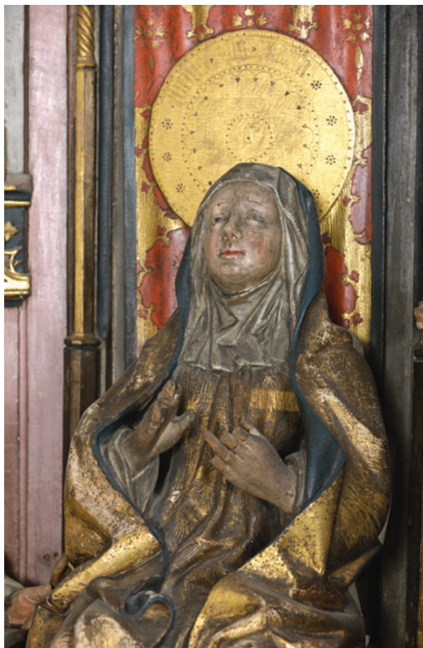
Neitsi Maarja retaabli korpusest

Kuulub EELK Tallinna Püha Vaimu kogudusele, paikneb altari